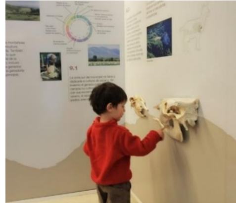
Castillo de Ordás y exposición didáctica del “Espacio Salto de Roldán”, en Sabayés.