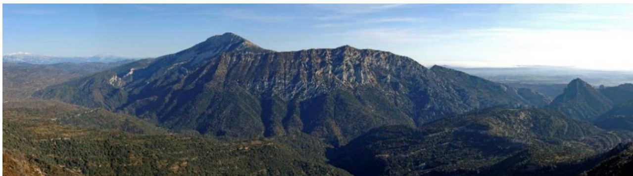
Vista del Tozal de Guara desde Nocito.

Guara tiene una amplia red de senderos y parajes que te impresionarán, tanto por su cara sur como por los valles de Belsué y Nocito de su cara norte. La ascensión al Pico del Águila (1623 m) desde el Centro de Interpretación de Arguis, el ascenso al Tozal de Guara desde Santa Cilia de Panzano o desde Nocito; la ruta circular por el Embalse de Santa María de Belsué por los acantilados de Cienfuens; el recorrido hasta la ermita rupestre de San Martín de la Val d’Onsera o la circular de Vadiello son algunas de las más populares, pero hay multitud de rutas para elegir.